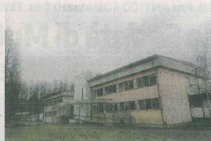
Sopra, l'attuale sede della succursale del Galilei che sarà demolita. Sotto, l'area dove sorgerà il nuovo plesso

sportivi esterni (da finanziare con fondi dell'ente metropolitano). Il nuovo plesso scolastico, che come prevede il bando avrà la stessa volumetria dell'attuale, ospiterà 26 aule e 2 laboratori, sarà ad elevata efficienza energetica all'interno dello stesso terreno di proprietà di CM con minimo impatto ambientale, disporrà di spazi didattici flessibili e innovativi, relazione con gli spazi esterni, uso di materiali durevoli, ecologici e soste-